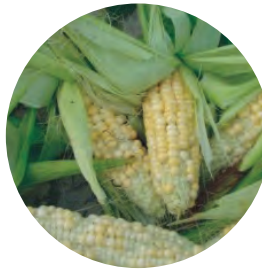
缺硼：玉米缺 硼造成籽粒不 饱满，秃顶