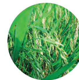
缺硼水稻易出现灌浆不饱满, 结实率低的现象