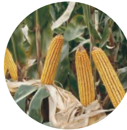
施硼：籽粒饱 满，产量高