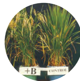
图左: 施硼植株 图右: 对照植株